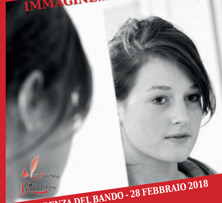
IMMAGINE... allo SPECCHIO